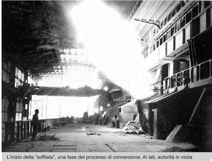
L'inizio della "soffiata", una fase del processo di conversione. Ai lati, autorità in visita